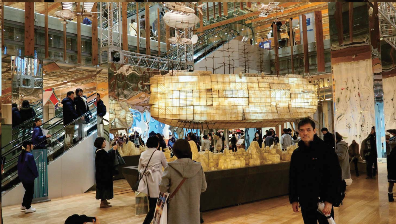
剛好展覽著宮崎駿作品，看到有天空之城的活動木工模型垂掛空中，非常震撼。