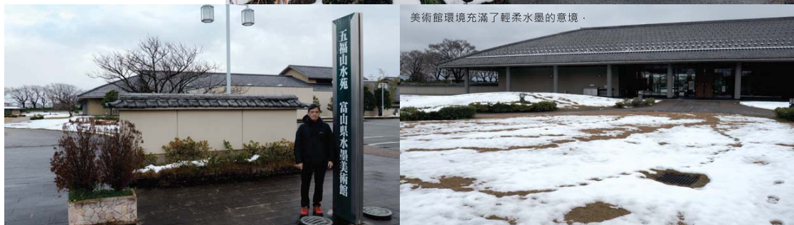
美術館環境充滿了輕柔水墨的意境。