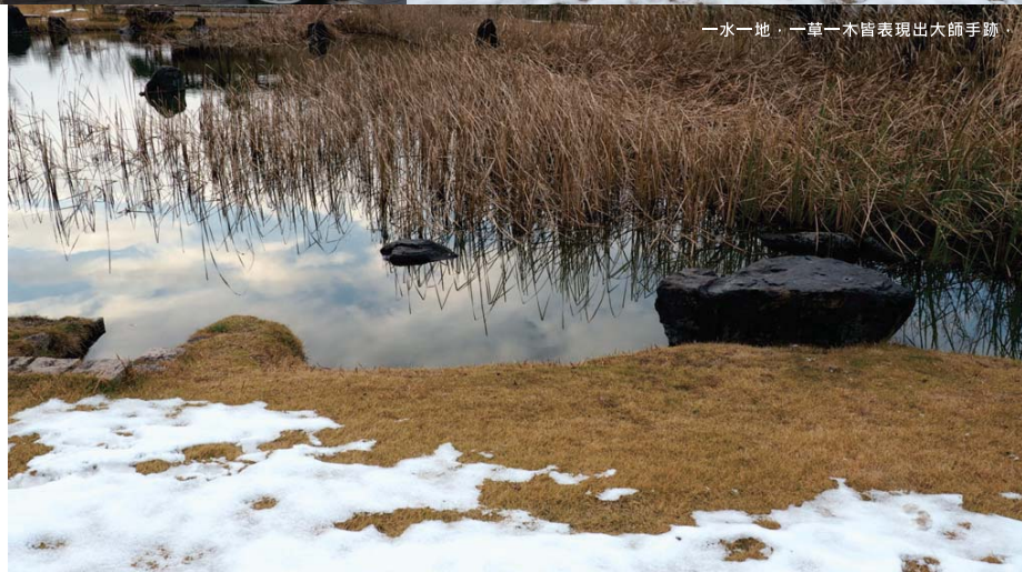
一水一地，一草一木皆表現出大師手跡。