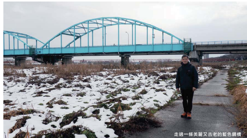
走過一條美麗又古老的藍色鋼橋