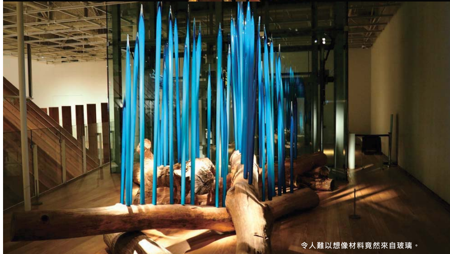
令人難以想像材料竟然來自玻璃。